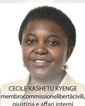
CECILE KASHETU KYENGE membro commissione libertà civili, giustizia e affari interni