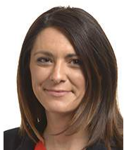
PINA PICIERNO membro commissione bilanci giuseppina.picierno@europarl.europa.eu

È FONDAMENTALE AVERE UN APPROCCIO DI GENERE QUANDO SI PARLA DI MEDIA E COMUNICAZIONE, SIA IN TERMINI DI IMMAGINE DELLA DONNA CHE VIENE DATA ATTRAVERSO DI ESSI, SIA DELLA PARTECIPAZIONE FEMMINILE NEL CAMPO DELLA COMUNICAZIONE IN GENERALE.