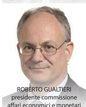
ROBERTO GUALTIERI presidente commissione affari economici e monetari