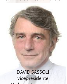
DAVID SASSOLI vicepresidente Parlamento europeo