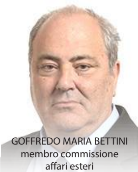
GOFFREDO MARIA BETTINI membro commissione affari esteri