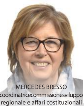
MERCEDES BRESSO coordinatrice commissione sviluppo regionale e affari costituzionali