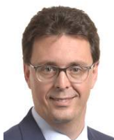
NICOLA DANTI coordinatore commissione mercato interno e tutela dei consumatori nicola.danti@europarl. europa.eu

LE PIATTAFORME COME FACEBOOK NON POSSONO IN ALCUN MODO ESSERE COMPLICI DELLA PROFILAZIONE DEI CITTADINI E DELLA MANIPOLAZIONE DELLE LORO INTENZIONI ELETTORALI CONDOTTA ATTRAVERSO LA DIFFUSIONE E LA SPONSORIZZAZIONE DI NOTIZIE TENDENZIOSE (E IN MOLTI CASI FALSE) VOLTE A FAVORIRE DETERMINATE TENDENZE POLITICHE ED A MANIPOLARE I CITTADINI NELL'ESPRESSIONE DEL LORO VOTO.