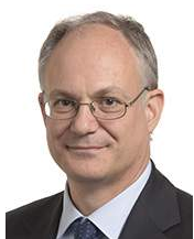
ROBERTO GUALTIERI presidente commissione affari economici e monetari roberto.gualtieri@europarl.europa.eu

NUOVE NORME PERMETTERANNO UN MAGGIOR LIVELLO DI TRASPARENZA RISPETTO AI BENEFICIARI EFFETTIVI DI SOCIETÀ E TRUST, E L'INTERCONNESSIONE DI QUESTI REGISTRI PERMETTERÀ UN PIÙ FACILE ED EFFICACE SCAMBIO DI INFORMAZIONI A LIVELLO EUROPEO