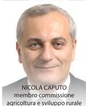
NICOLA CAPUTO membro commissione agricoltura e sviluppo rurale