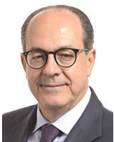
PAOLO DE CASTRO coordinatore commissione agricoltura e sviluppo rurale paolo.decastro@europarl. europa.eu

NON È STATO FISSATO ALCUN LIMITE MASSIMO DI SOSTANZE NON AUTORIZZATE (PESTICIDI O ALTRE) CHE POSSONO ESSERE CAUSA DI CONTAMINAZIONE, TRADENDO LA DEFINIZIONE STESSA DI AGRICOLTURA BIOLOGICA, QUALE SISTEMA AGRICOLO CHE PUNTI A RIDURRE AL MINIMO GLI INPUT ESTERNI PRESERVANDO LA NATURALE FERTILITÀ DEL TERRENO E SFRUTTANDO AL MASSIMO I MECCANISMI E GLI EQUILIBRI NATURALI