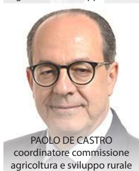
PAOLO DE CASTRO coordinatore commissione agricoltura e sviluppo rurale