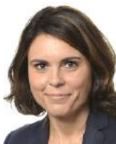
SIMONA BONAFÈ membro commissione ambiente, sanità e sicurezza alimentare

L'INNALZAMENTO DEI TARGET DI RICICLAGGIO DEI RIFIUTI URBANI E DA IMBALLAGGIO, L'INSERIMENTO DI UN LIMITE DI CONFERIMENTO MASSIMO IN DISCARICA PARI AL 10 PER CENTO, L'ESTENSIONE DEGLI OBBLIGHI DI RACCOLTA SEPARATA AI RIFIUTI ORGANICI, TESSILI E DOMESTICI PERICOLOSI SONO LE PRINCIPALI NOVITÀ