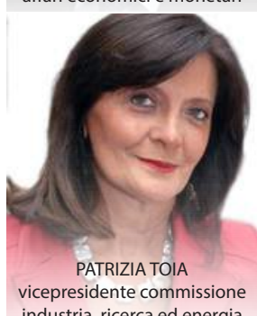
PATRIZIA TOIA vicepresidente commissione industria, ricerca ed energia