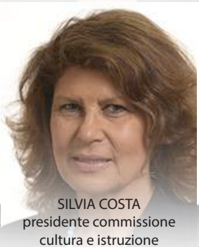
SILVIA COSTA presidente commissione cultura e istruzione